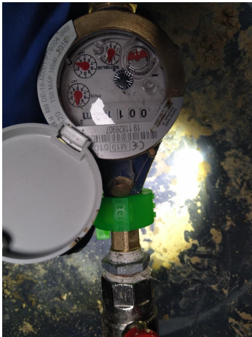
Obrázok 9: Zabezpečovacia značka montážnika s evidenčným číslom