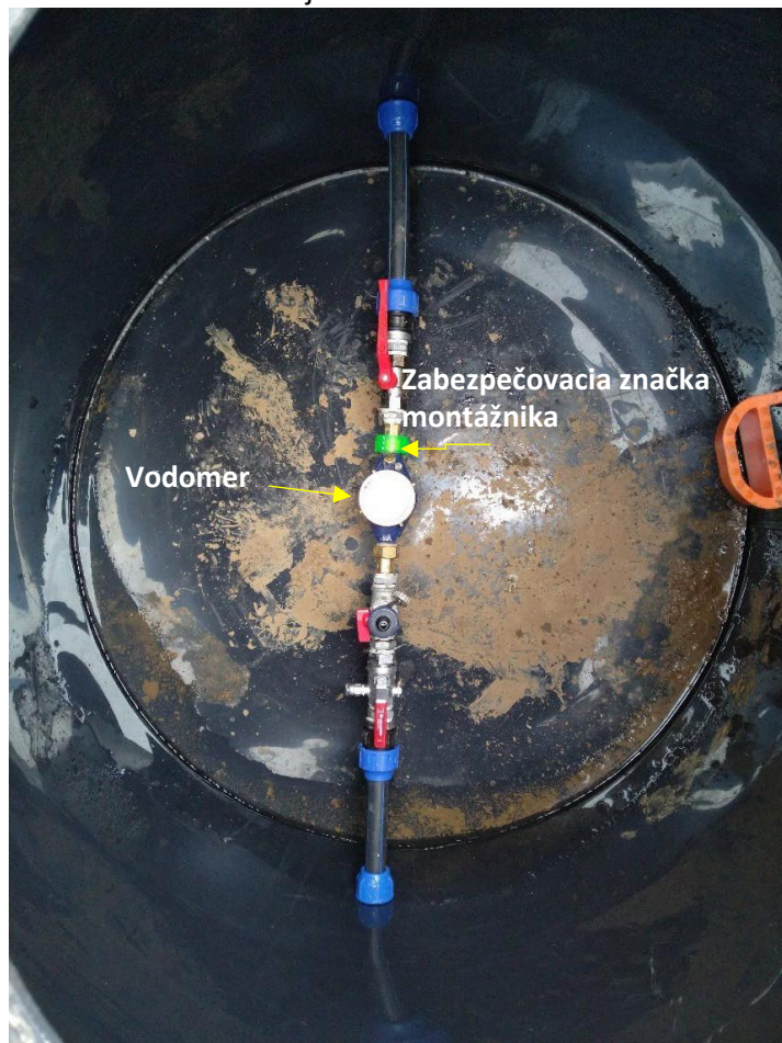
Obrázok 7: Vodomer, vodomerná zostava a umiestnenie zabezpečovacej značky montážnika vo vodomernej šachte