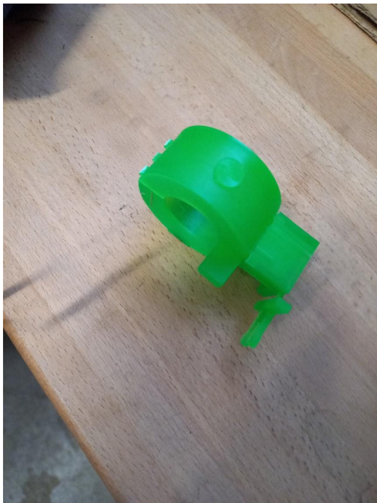
Obrázok 5: Zabezpečovacia značka montážnika