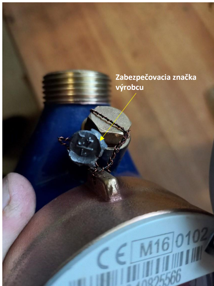
Obrázok 3: Zabezpečovacia značka výrobcu